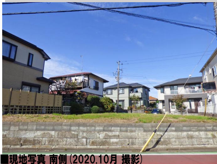
■現地写真 南側 (2020.10月 撮影)