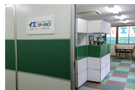
西東京市富士町4-16-9 2F 毎週水曜定休日

東京都知事(3)第85856号 (公社)全日本不動産協会会員 (公社)不動産保証協会会員 (公社)首都圏不動産公正取引協議会加盟